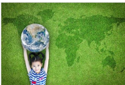
地球にやさしいホテル

地球環境に負荷の少ないホテルを目指して、グリーンコイン活動や水素エネルギーを活用したホテルの運営、食品廃棄物の削減やリサイクルなどで脱炭素・循環型社会の実現に貢献します。