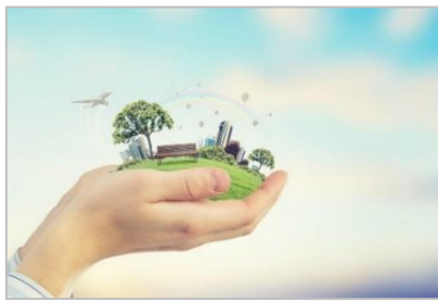
まちにやさしいホテル

地域に根ざした愛されるホテルを目指して、地域のお祭りや行事に積極的に参加したり、災害時の帰宅困難者受入れや営業の早期再開などを通じて地域の発展に貢献します。