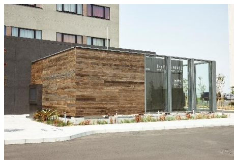
昨年まで稼働していた純水素型燃料電池

東急ホテルズでは2019年に「サステナブル方針」(※5)を制定し、“地球にやさしいホテル・まちにやさしいホテル・ひとにやさしいホテル”を掲げ、ホテル事業を通じて「持続可能な社会」の実現を目指し、さまざまな取り組みを行っております。また、このたびサステナブル方針に基づいて、より具体的な「アクションプラン2022」(※6)を設定しました。今後、運営する全ホテルに共有し、目標達成に向け、進めてまいります。