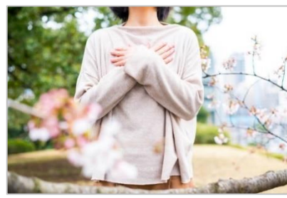
ひとにやさしいホテル

“居心地のいいホスピタリティ”の提供を目指して、ユニバーサルルームやベジタリアンメニューなどを充実させるとともに、働きやすい職場づくりや人財育成を通じてホテルの財産である“人”づくりを進めます。