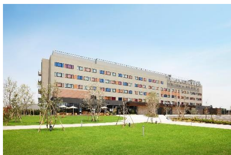
川崎キングスカイフロント東急 REI ホテル

2021年9月15日、同ホテルは環境省の「脱炭素社会構築に向けた再エネ等由来水素活用推進事業」に採択され、「水素サプライチェーン社会実装支援事業」(※4)として、トヨタ自動車株式会社製燃料電池(FC)モジュールを使用した明治電機工業株式会社製の「50kW 純水素型定置式FC発電システム」を導入し、2023年1月より再び「水素ホテル」として水素発電を継続することを決定しました。