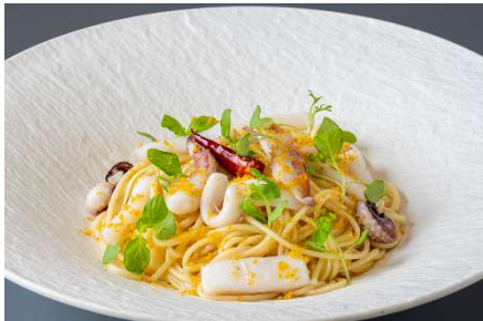
長崎産カラスミと島原産甲イカの手延ベスパゲッティ レモンバター風味

[内容] 長崎産カラスミと島原産甲イカの手延ベスパゲッティ レモンバター風味 2,200 円 / 羽カツオの燻製と鰹ちぎり揚げ野菜のクリーム手延ベスパゲッティ 2,200 円 / 地鶏しまさざなみとパプリカの五島の醤を使った和風手延ベスパゲッティ 2,200 円