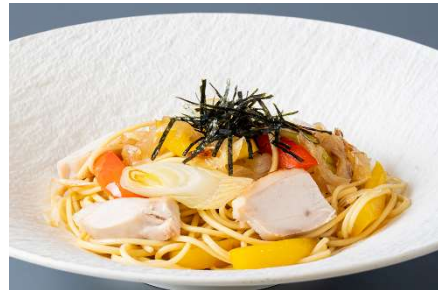
地鶏しまさざなみとパプリカの五島の醤を使った和風手延ベスパゲッティ