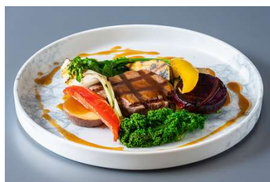
五島産和牛フィレ肉の網焼き 雲仙つむら農園の温野菜添え