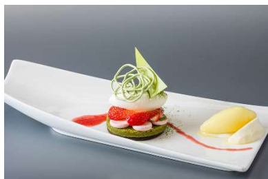
長崎産そのぎ抹茶と苺のタルト 日向夏のソルベを添えて