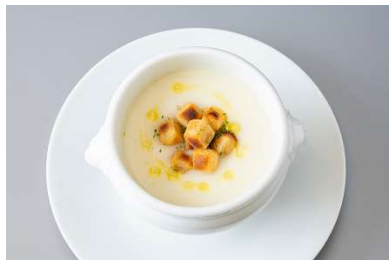
長崎産新玉ねぎのポタージュ かんころ餅添え