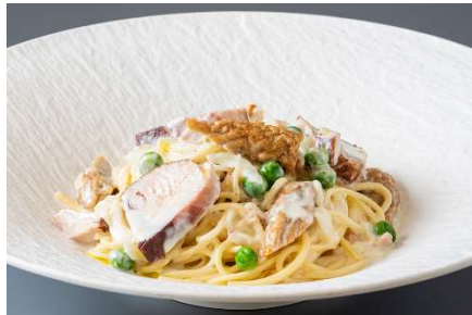
羽カツオの燻製と鰹ちぎり揚げ野菜のクリーム手延ベスパゲッティ