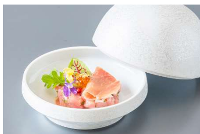
長崎産養殖マグロのタルタルと生ハム 五島産椿オイル風味