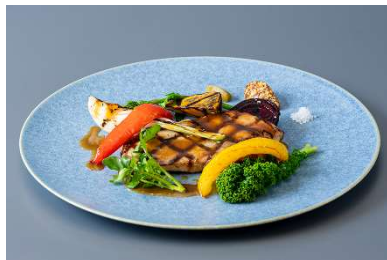
諫早産諫美豚ロースのシンプルな網焼き 五島灘の潮、粒マスタード、柚子胡椒添え