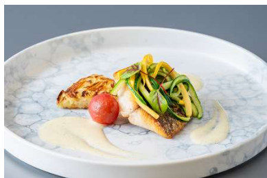
五島産イサキのポアレ じゃが芋のガレットとズッキーニのヌイユ添え 大和バナナビーンズ風味のブルブランソース