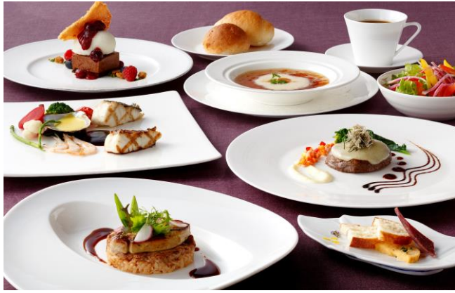
①洋食コース:エクセレントディナー