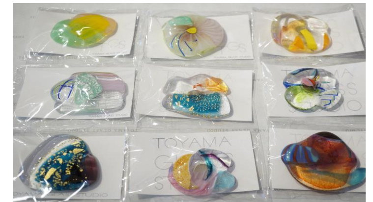
⑥プレゼント:ガラスのマグネット ディナーコースお召し上がりのお客様先着300名様