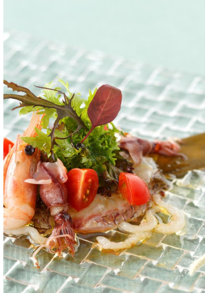
真鯛の昆布締めと富山産シロエビとホタルイカのマリネ 甘海老と一緒に

羽田エクセルホテル東急(所在地:東京都大田区、総支配人:高橋博紀)では、2016年5月1日(日)～2016年6月30日(木)の期間、カフェ&ダイニング「フライヤーズテーブル」(2階)にて、AMAZING TOYAMA(アメイジングトヤマ)へようこそ！「富山フェア」を開催いたします。