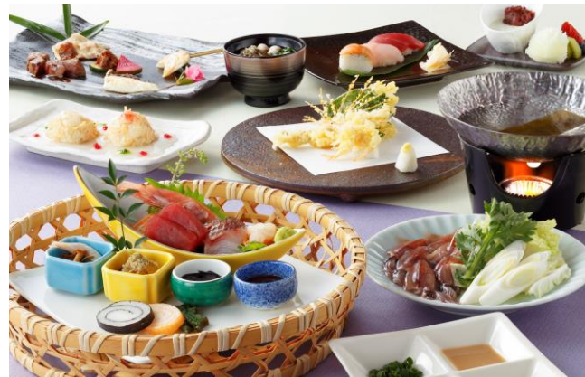
②和食コース:季節の会席コース