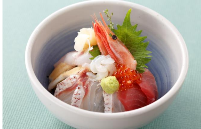
⑤シロエビと昆布締めした真鯛と海鮮丼