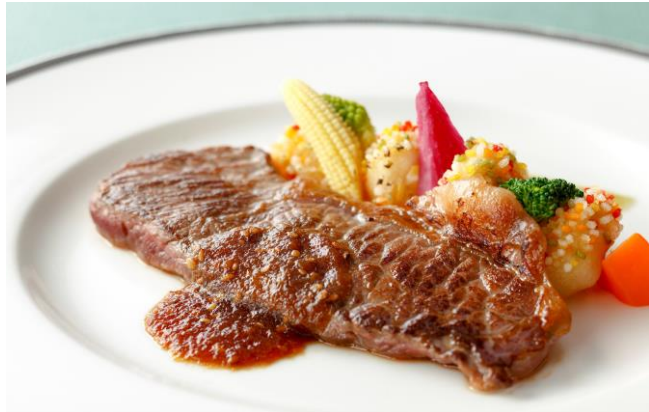
④アラカルト:US産牛肉イチボの昆布締め のポワレ 昆布と生姜入り和風胡麻ソース