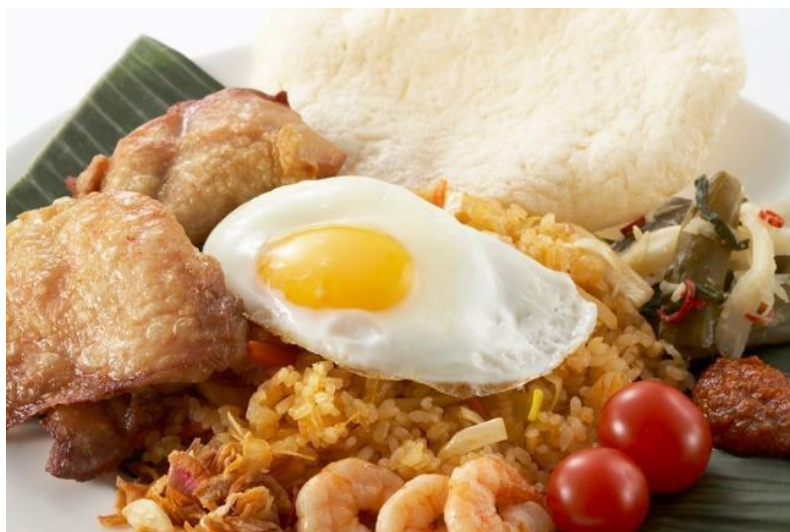
インドネシア風辛口ピラフ ナシゴレン