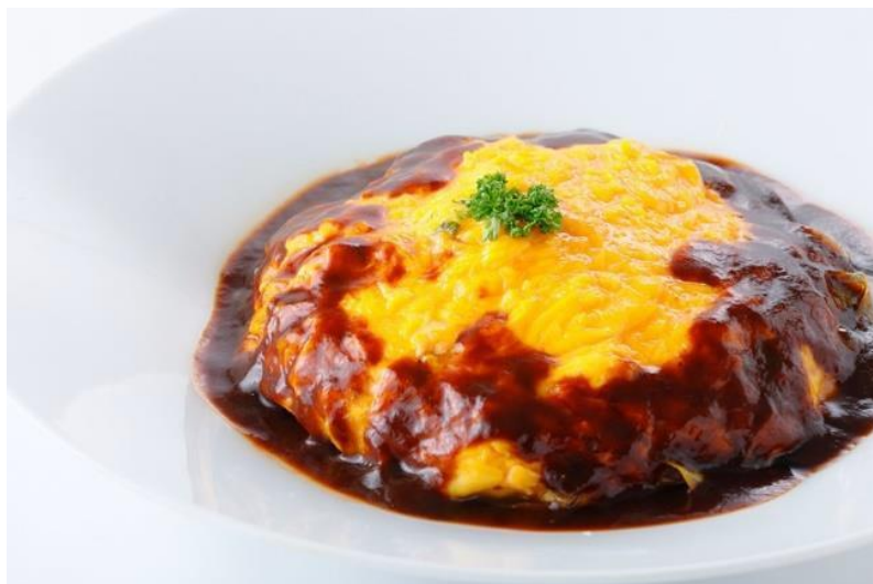
名古屋コーチン卵の親子オムライス